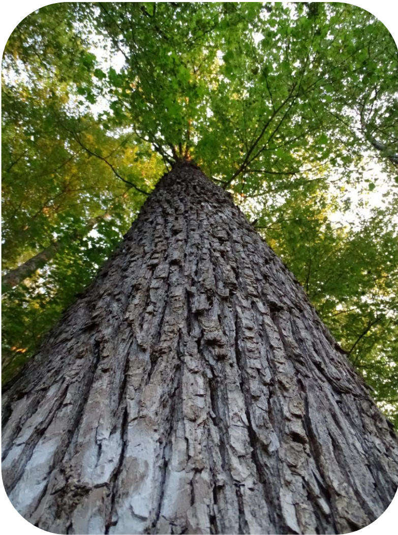
Baumhasel mit ausgezeichneter Stammform bei Surdulica, Serbien