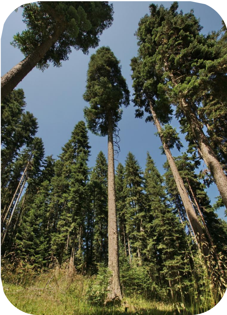
Türkische Tanne in ihrem natürlichen Verbreitungsgebiet